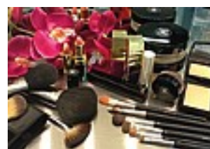
Cosmetici non solo per le star...

venta infatti una vera e propria "opera d'arte". Questo autunno/inverno sono in programma da Glitter vari corsi, per addetti ai lavori, ma anche per chi non è "specializzato": il sabato, o su richiesta, si tengono lezioni di make up individuale o a gruppi