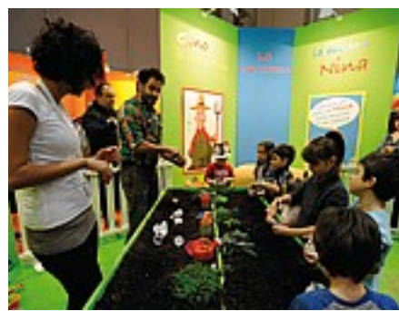
Tanti giochi per i bimbi in fiera con i genitori

Su www.gcomegiocare.it è possibile iscriversi alla newsletter e ottenere una riduzione da 9 a 5 euro sul biglietto di ingresso per adulto (ingresso bambini fino a 14 anni: 1 euro; gratis per bambini sotto i 2 anni).