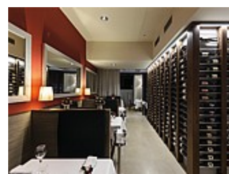
Ambiente high tech per degustare la tradizione

ambiente che non fosse banale, ma accogliente ed elegante, con dettagli architettonici preziosi (i decori della cucina sono di Fornasetti e le ceramiche dei bagni di Van Der Hilst): insomma una sorta di 'ponte' tra la tipica 'trattoria' e il locale d'alta